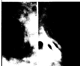
Was sehen Sie?