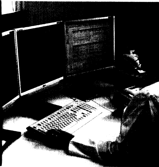
Fernüberwachung von chronisch Kranken: Neue Techniken der Telemedizin machen es möglich. Seite 34