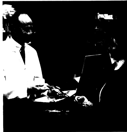
Pharmazeutische Betreuung bundesweit in den Apotheken zu etablieren, gehört zu den Zielen der Förderinitiative Pharmazeutische Betreuung. Seite 24