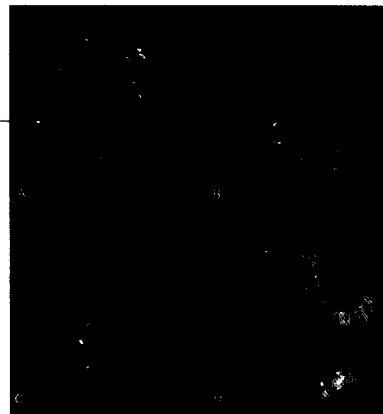
Bei akuter Colitis ulcerosa verschlechtert sich die Darmschleimhaut immer weiter

Primär biliäre Zirrhose: Ursodeoxycholsäure früh geben 14