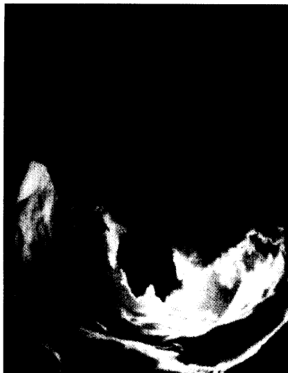
Ein zu niedriger HDL-Wert kann die Entstehung einer koronaren Herzkrankheit begünstigen. Seite 16