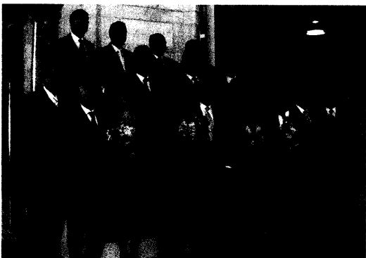
Das neue Bayerische Kabinett.

Titelbild: Podiumsdiskussion anlässlich des 64. Bayerischen Ärztetages in Regensburg.