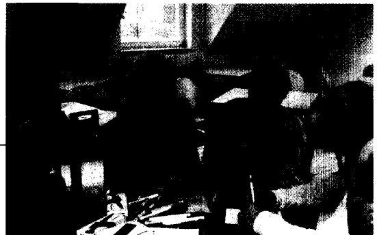
Ältere Diabetiker profitieren von speziellen Schulungsprogrammen