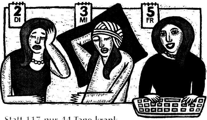
Statt 117 nur 44 Tage krank 46

Beilagenhinweis: Diese Ausgabe enthält eine Teilbeilage der Georg Thieme Verlag KG, Stuttgart