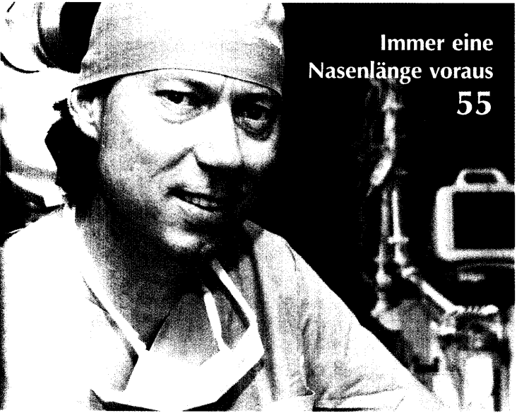
Immer eine Nasenlänge voraus 55