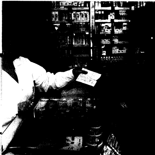
Die AOK-Rabattverträge stehen auf der Kippe. Das könnte auch den Beratungsbedarf in Apotheken steigen lassen. Seite 6