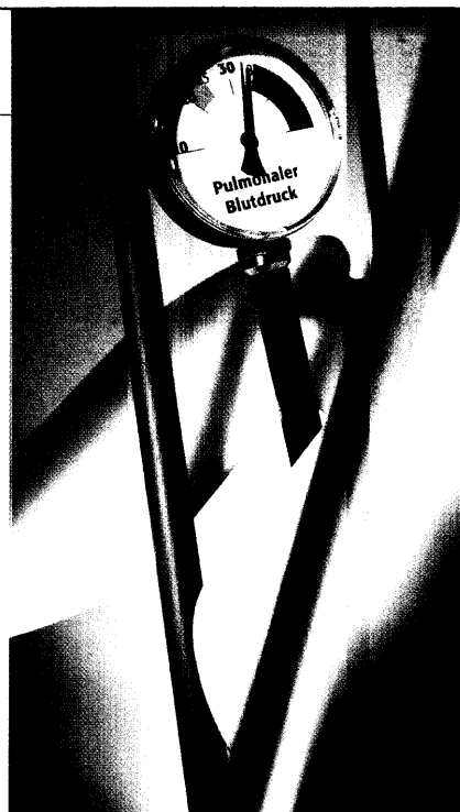
Endothelin-Antagonisten bringen einen Überlebensvorteil für Patienten mit pulmonalem Bluthochdruck. Seite 16