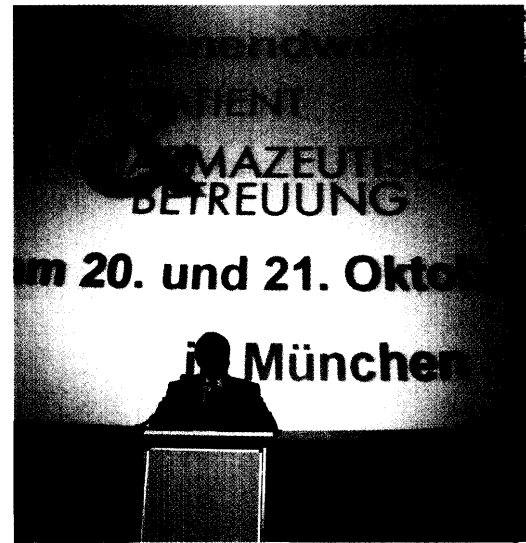
Zum Wochenendworkshop »Patient & Pharmazeutische Betreuung« in München kamen rund 280 Teilnehmer. Seite 22