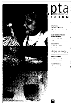
In dieser Ausgabe finden Sie das Supplement PTA-Forum 10/2007.