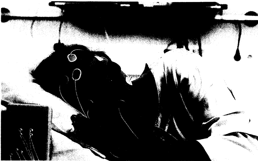
Exzessive Tagesschläfrigkeit belastet die Betroffenen sehr. Die Ursachen sind schwer zu ermitteln – oft hilft ein Besuch im Schlaflabor. Seite 38