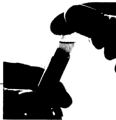
Auch in der Diagnostik der Dyslipidämie lauern Fallstricke