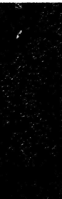
Titelbildvorlage: Lymphknotenmetastase (s. dieses Heft S. 2079).