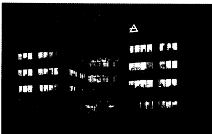
Der Verwaltungssitz von Air Products Medical in Hattingen.