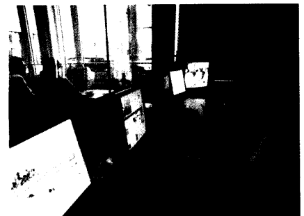
Schwachpunkte medizinischer Apparaturen lassen sich gut bei Usability-Prüfungen mit Anwenderbeteiligung entdecken.