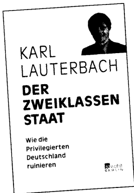
Sind seine Argumentationen zur „Zweiklassenmedizin“ schlüssig?