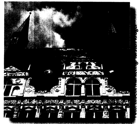
Renaissancelaube am Rathaus