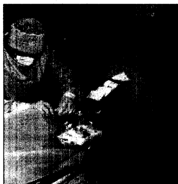
Entscheidung am Katheter- ...messplatz: Upload oder nicht?

unnötigen Blutungsrisiko aus- ...gesetzt. Dies hat eine neue ...Studie ergeben, die beim ...Europäischen Kardiologen- ...kongress in Wien vorgestellt ...worden ist. Denn eigentlich ist ...dieses Vorgehen nicht erfor- ...derlich: Gibt man Clopidogrel ...erst während des Katheterein- ...griffs, also wenn die Angio- ...grafie die Notwendigkeit einer ...Dilatation zeigt, dann reicht ...das völlig aus. Seite 12