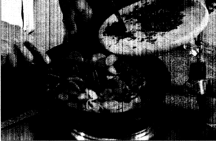
Den optimalen Speiseplan gibt es nicht: Gemüse gehört aber dazu.

...vaskuläre Ri- ...ssen, ist seit lan- ...t. Aber was sollte ...t auf den Tisch ...zu gibt es eine ...zelbefunde, die ...erraschen. Zum ...e Reduktion des ...nd vor allem der ...Fette führt bei ...em schlechteren ...nten, wohinge- ...i Männern das ...erbessert. Wenn ...hrungsfette par- ...ohlenhydrate er-