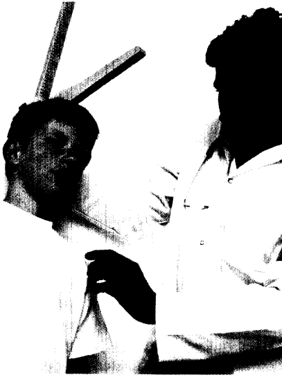
Akromegalie: Zu einem Riesenwuchs kommt es nur, wenn das verursachende Hypophysenadenom schon in der Kindheit auftritt. Seite 42