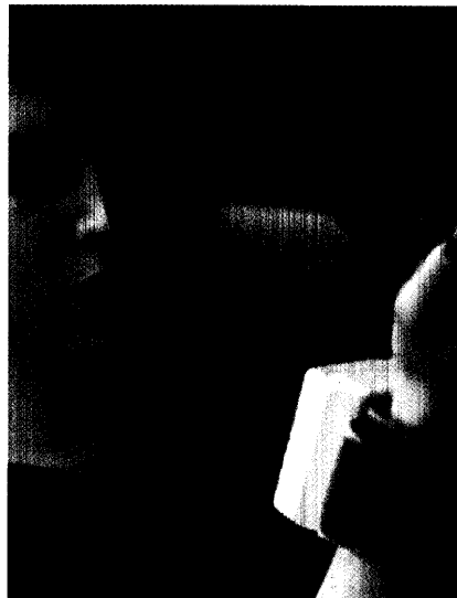
Viel Zeit und Arbeit bei der Genehmigung von Hilfsmitteln erspart den Apothekern in Westfalen-Lippe eine Clearingstelle. Seite 51