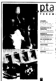
In dieser Ausgabe finden Sie das Supplement PTA-Forum 9/2007.

Marktkompass 62 / Forum 76 / Per- sonalien 106 / Kalender 112 / Fir- menkalender 114 / Impressum 128 / Stellenmarkt 129 / PZ-Markt 145 /