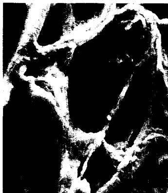
Titelbild: Adventitia (Falschfarbendarstellung).