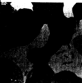
Dunkel gefärbte bipolare Enden von Y. pestis im Blut eines Pest-Opfers.