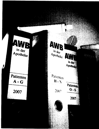
Anwendungsbeobachtungen in Apotheken liefern nicht nur wichtige Daten, sondern schärfen auch das Profil der Apotheke. Seite 20