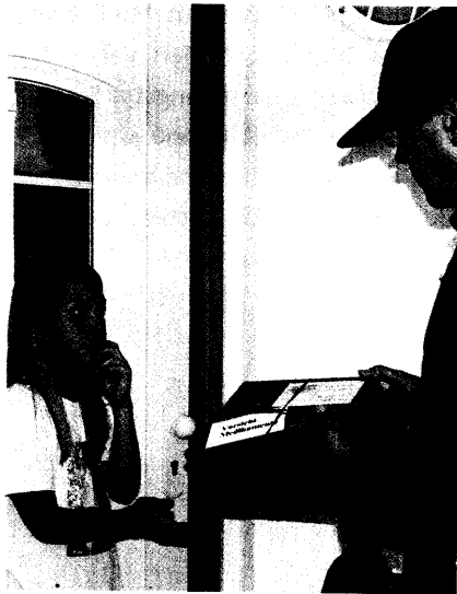
Der Europarat macht sich Sorgen: Versender interessieren sich nicht dafür, in welche Hände ihre Pakete kommen. Seite 8