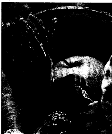
Wasserreiche Nahrung, etwa mit To...

N (mut). Viel m abnehmen – versprechen lich die über- schmelzen. aber, dass die er und wenig statt Steaks eher kalorien- t und Gemüse.