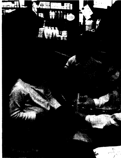
Die Arbeit in der Apotheke bringt auch Gefährdungen mit sich. Ein professioneller Arbeitsschutz hält Risiken klein. Seite 42