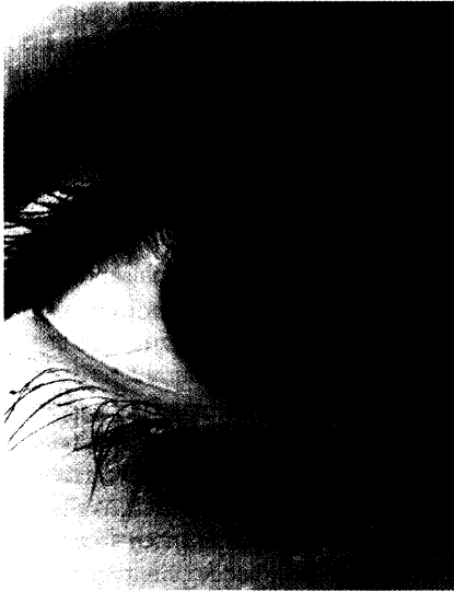
Das Auge vollbringt bei der Arbeit am Computer Höchstleistungen. Eine Überforderung kann Beschwerden verursachen. Seite 36