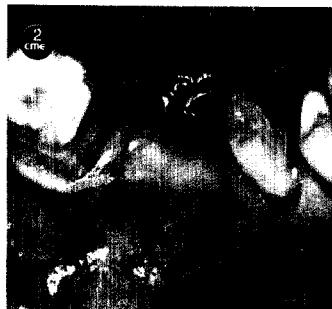
Total- rehabilitation im Oberkiefer Seite 412