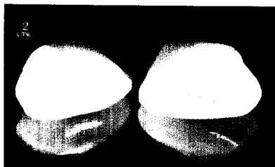
Dental Design: Keramikveneers Seite 436