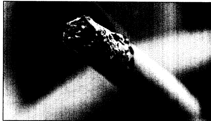
Wenn das nicht mehr schmeckt, liegt es vielleicht an der Impfung

Einige Medikamente, Nikotinkaugummis oder -pflaster helfen dem Raucher zweifellos bei seinen Abstinenzbemühungen – aber unterm Strich und über die Zeit hinweg betrachtet, ist der Erfolg doch begrenzt. Jetzt wurde erstmals eine Impfung gegen Nikotin getestet. Wie es funktioniert und welche Erfolge die ersten Versuche gebracht haben, lesen Sie auf Seite 14