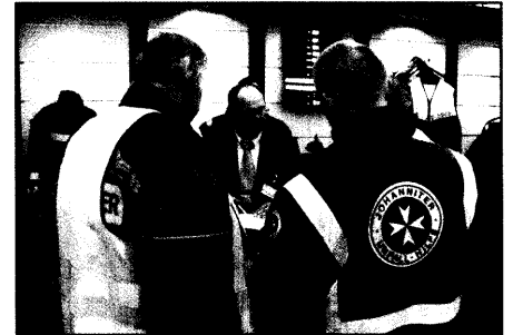
Besucherrekord auf der RETTmobil

Andreas Pitz: Was darf das Medizinalpersonal? 20 Bundesministerium für Arbeit und Soziales: Übersicht über das Sozialrecht 20 Bundesanstalt für Straßenwesen: Hindernisse für grenzüberschreitende Rettungseinsätze 21 Bundesministerium für Arbeit und Soziales: Übersicht über das Arbeitsrecht / Arbeitsschutzrecht 21