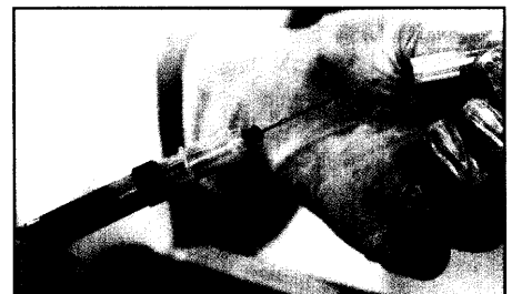
Nadelstichverletzungen kosten jährlich 47 Mill. Euro