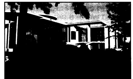
Anhörung im Deutschen Bundestag