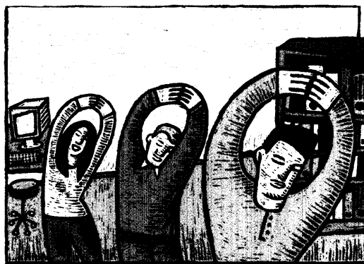
Goldene Zukunft 22