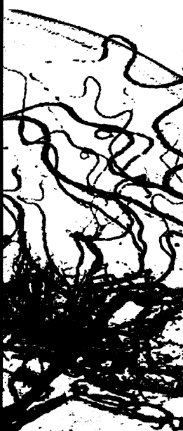
Titelbildvorlage: Angiographie der Hirngefäße (s. dieses Heft S. 1750).