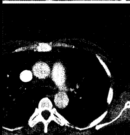
Computertomogramm des Thorax mit floriden milchglasartigen Lungeninfiltraten