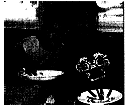
Berlin isst gesund