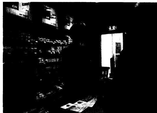
In Easy-Apotheken fühlen sich Kunden wie im Drogeriemarkt. Seite 36