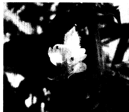
Zaubersalbei: Die Bundesregierung erwägt derzeit, die Rauschpflanze als Betäubungsmittel einzustufen. Seite 30

Marktkompass 44 / Forum 52 / Per- sonalien 62 / Kalender 65 / Stellen- markt 67 / PZ-Markt 79 / Impres- sum 66