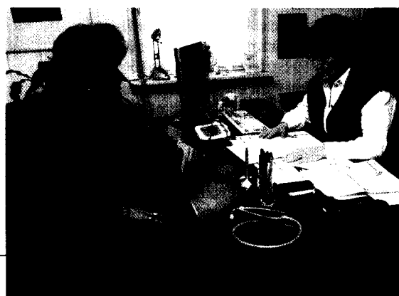
Obleich der Inhalt der Leitlinien den meisten Ärzten bekannt ist, halten sich viele nicht daran – warum?

Das Einmaleins der Tumorschmerz-Therapie 6 Kopf-Hals-Tumoren: Blockade des Wachstumsfaktors 8 Pegyliertes Interferon in der Melanomtherapie 10 Wachstumsfaktor G-CSF beugt febriler Neutropenie vor 12 Lymphödembehandlung nach Mammakarzinom 13