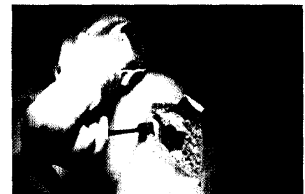
Knieoperationen im Alter: Seite 24