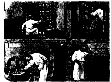
Gripeschutzimpfung: für Senioren besonders wichtig Seite 8