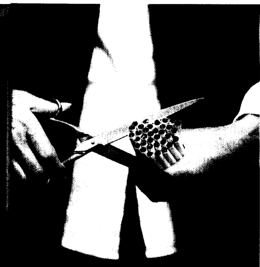
Weg von den Zigaretten: Das ist der Wunsch vieler Raucher. Seite 30