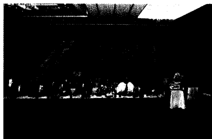
Folge der Veränderungen im Gesundheitsmarkt: ein wachsendes Interesse an Netzwerken und Info-Veranstaltungen.