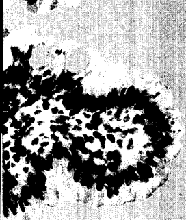
Titelbildvorlage: CD8-Lymphozyten im Duodenalepithel (s. dieses Heft S. 1572).