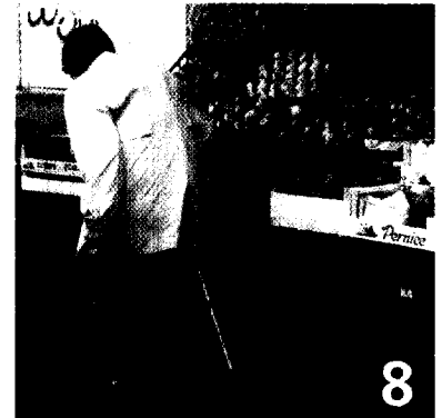
IN DER OSTEOPOROSE-THERAPIE wird derzeit diskutiert, ob eine Behandlung länger als drei bis fünf Jahre dauern sollte.