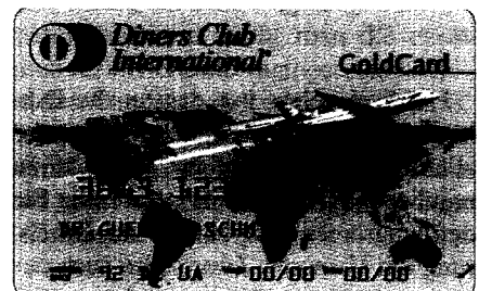
Die Karte für Mediziner. Gratis zum Abo. (mehr auf Seite 50)