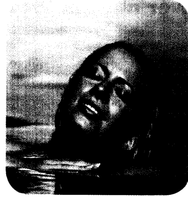
Die Gefahr der Photosensibilisierung durch Arzneimittel ist ein nicht zu unterschätzendes Problem, denn zahlreiche Substanzen können die Auslöser für Lichtdermatosen sein. Seite 36