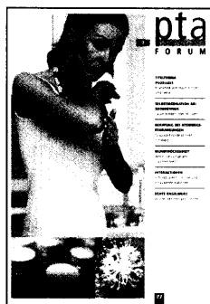
In dieser Ausgabe finden Sie das Supplement PTA-Forum 7/2007.

Genomforschung Krankheits-Genen auf der Spur