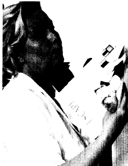
Mit Desvenlafaxin könnte bald eine Alternative zur hormonellen Behandlung von Wechseljahresbeschwerden verfügbar sein. Seite 24