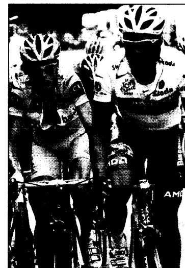
Unterwegs in Richtung Gipfel: Alberto Contador und Michael Rasmussen (links)

Die neuen Erkenntnisse haben Konsequenzen für die Therapie: So sollen Patienten mit einem