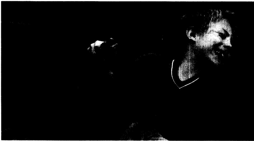
Erwachsenen verschließen sie sich, doch mit Hunden werden verhaltensauffällige Kinder schnell warm. Seite 38