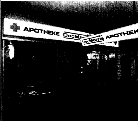
Bis zum Jahresende will DocMorris 59 weitere Markenpartner-Apotheken gewinnen. Seite 6