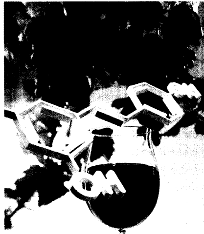
Resveratrol ist derzeit einer der interessantesten Stoffe in der Phytoforschung. Erfahren Sie mehr ab Seite 16.