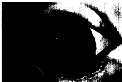
Von Einschlaf- und Durchschlafstörungen sind 15 bis 30 Prozent aller Kinder im Vorschulalter betroffen. Seite 6.