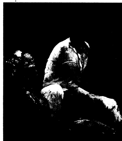
Franzosen aus New York und Giraffen aus Nahost: Einblicke in den deutschen Kunstsommer. Seite 50