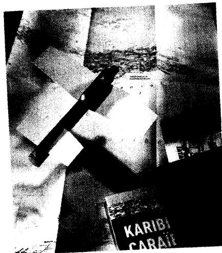
Wichtige Tipps zur Reisevorbereitung für Diabetiker finden Sie ab Seite 16.