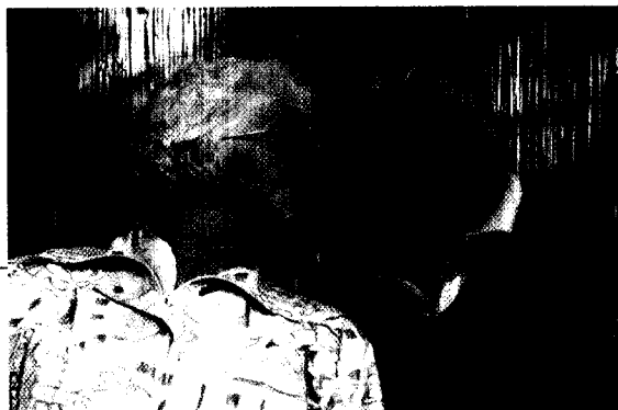
Kein Tabu mehr: Sexualität im Alter