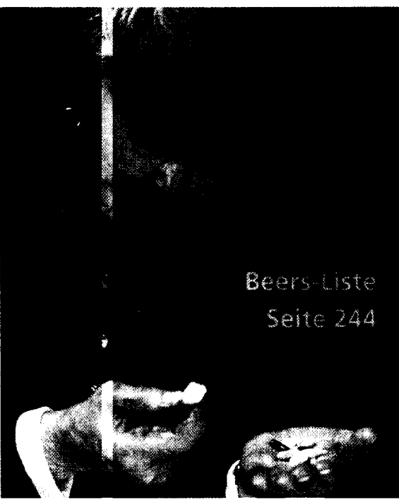
Beers-Liste Seite 244