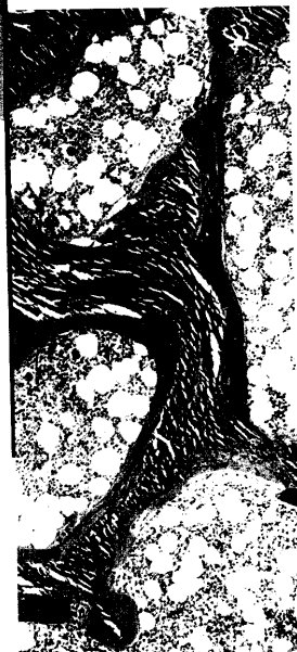
Titelbildvorlage: Ausgeprägte Osteomalazie unter Langzeit- therapie mit Phenhydan (s. dieses Heft S. 1476).

www.deutscherinternistentag.de Jetzt online anmelden! ➔