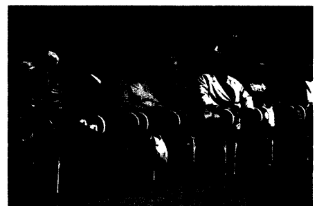
Weisheit im Alter